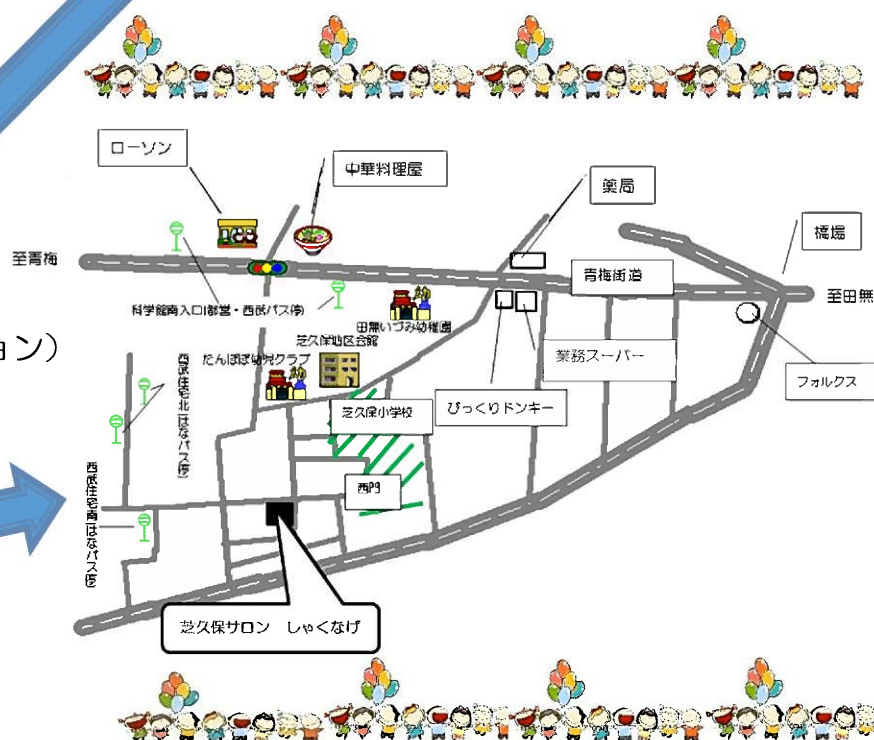
しゃくなげ地図 (芝久保町 3-11-3)