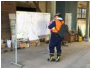
原宿サテライトの様子

私が配置されたのは、本部から車で20分程の所にある石毛サテライトの更に先にある、原宿サテライトという最前線の現場で、私の配属時には、私のほかに長く運営側として活動しているボランティアさん1名と近隣社協の職員2名の基本4人が、マッチング、送り出し、迎え入れ、ニーズの受付、車両の手配、現場確認、資機材の手配などを行っていました。このサテライトは電気と水が使えず、休憩できるスペースもないため、ボランティアの皆さんはバスで到着した後、オリエンテーションとマッチングを済ませ、地図を頼りに活動に必要な資材を持って依頼者宅へ基本徒歩で赴き、活動終了後は報告を済ませた後、バスで石毛サテライトに向かい、そこで泥の付いた長靴を洗ったり、休憩を取ることとなります。