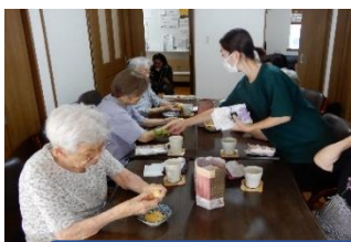
おとなりさん。小金井公園