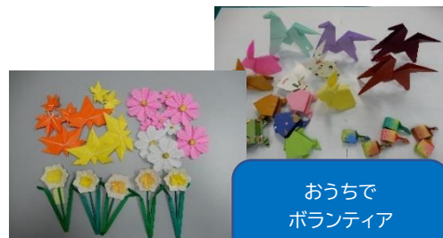
おうちで ボランティア ～折り紙～