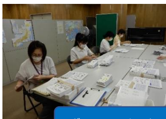
ボランティアセンター