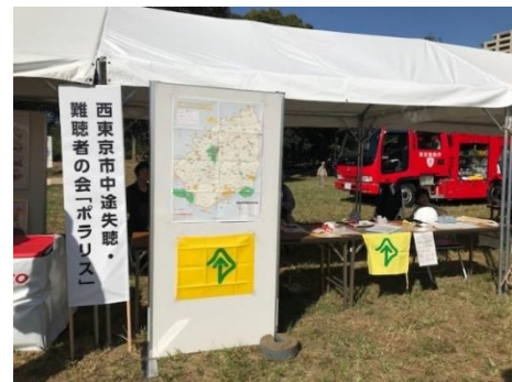
市の総合防災訓練