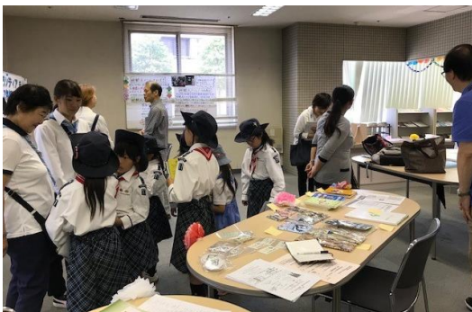
ボランティアのつどい（ボラフェス）

毎月1回の定例会や、ボラフェス、防災訓練、地域のイベントなどに参加しています。会員交流のための行事も不定期に開催しています。