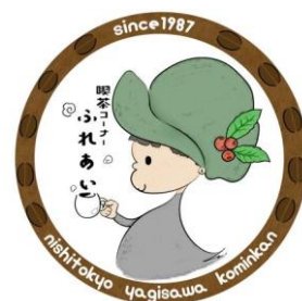
喫茶コーナーふれあいのキャラクター