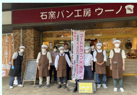
石窯パン工房 ウーノ