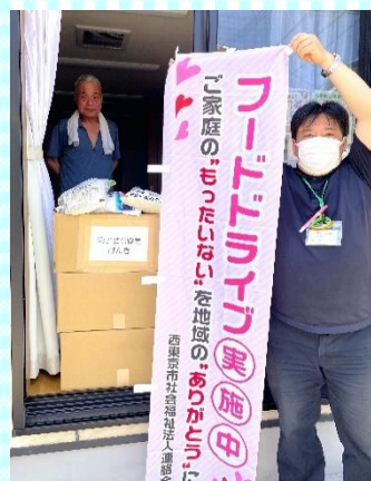
子ども食堂げんき