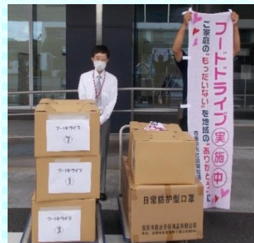
SOMPO ビジネスサービス