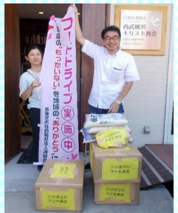
やぎさわ子ども食堂