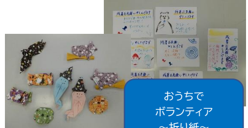
おうちで ボランティア ～折り紙～