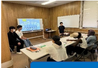
日本語教室とびら