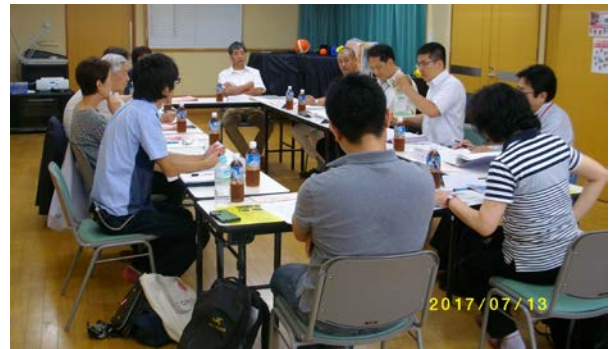
(7月13日(木) 人材確保・育成活動分科会の様子)

人材確保・育成分科会では、各法人共通の課題である人材の確保のあり方について検討します。また法人同士が連携・協力した職員研修の検討や実施をし、人材の育成にも取り組みます。