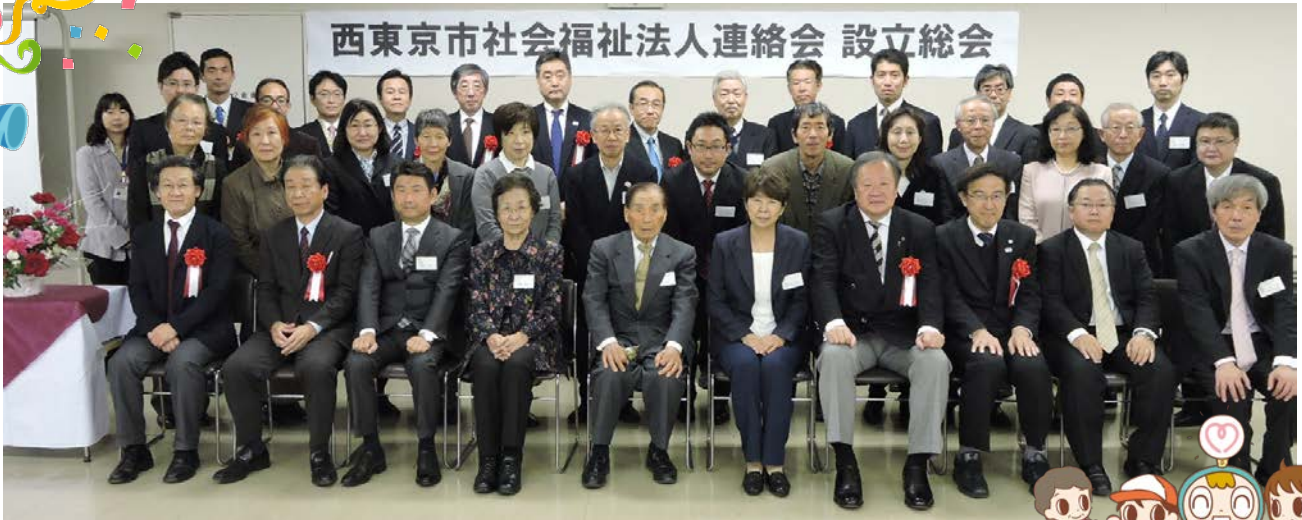
西東京市社会福祉法人連絡会設立総会より