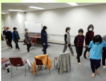
裸足になって正しい歩き方レクチャー