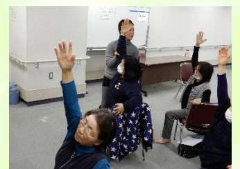
椅子に座ってできるヨガ