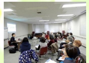
免疫力アップについて真剣に聞かれる参加者の方々

談の部分が新型コロナウイルス感染症の対策のため、中止となってしまいましたが、これからもボランティアを継続するためのいいきっかけとなりました。