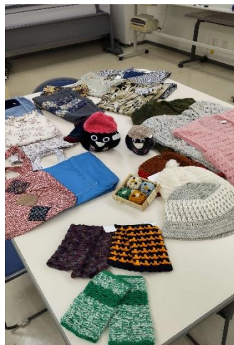
<「まりも」の活動の製作品>