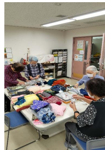
<値付けの作業中です>