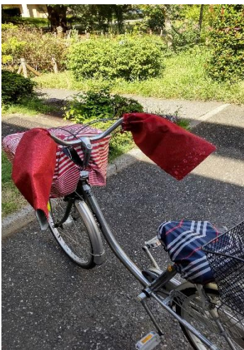
<とても便利!自転車カバー>

(活動日に直接活動先へお持ちいただくか、ボランティア・市民活動センターにご相談ください)