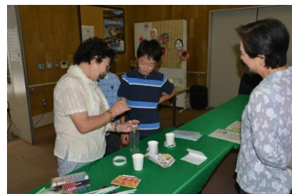
昨年のボランティアのつどい