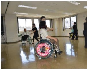
2014.6 第12回 ボランティアのつどい 車いすダンス

「どんなボランティア活動があるの？」 「どんなことをしているの？」 「あなたの興味(知りたい、はじめたい) にいろいろな分野のボランティア活動 団体が応えます。」