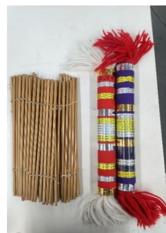
<玉簾と銭太鼓。意外と重さがあります!>