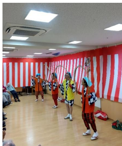
<後光を作って「観音様」>