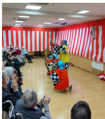
<皆で合体させて「東京タワー」>