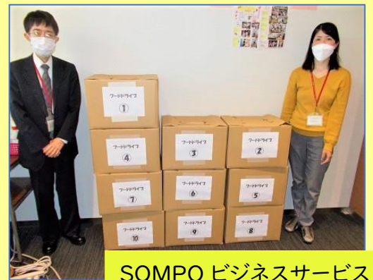
SOMPO ビジネスサービス