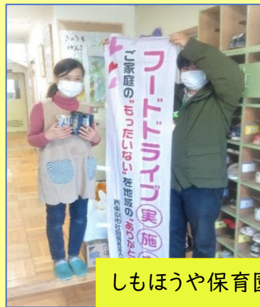
しもほうや保育園