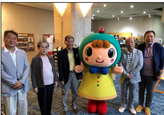
清水会長と実行委員の皆さまです 大会までのご尽力ありがとうございました。