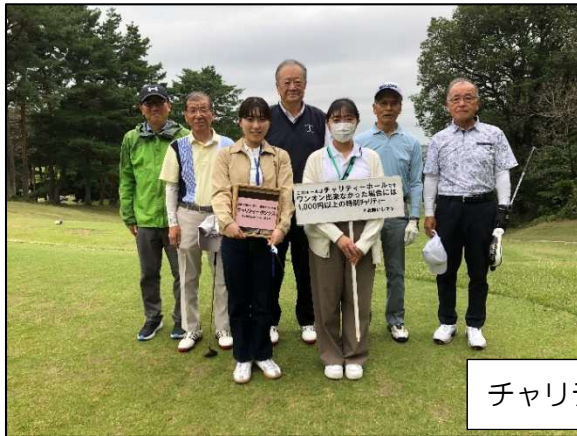
チャリティーホールスタート前のワンショット。