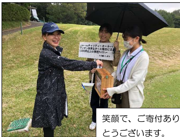
笑顔で、ご寄付ありがとうございます。