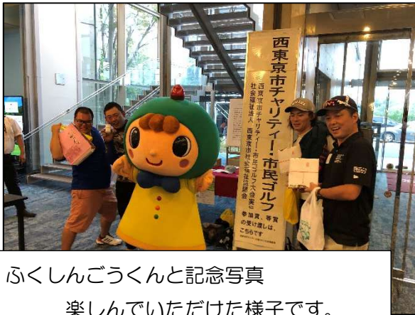
ふくしんごうくと記念写真楽しんでいただけた様子です。