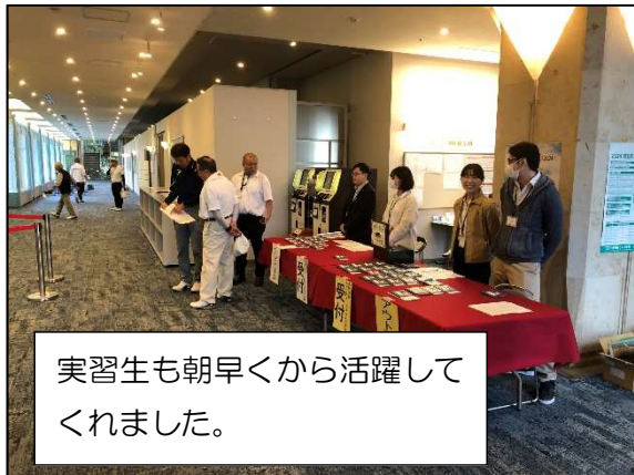
実習生も朝早くから活躍してくれました。