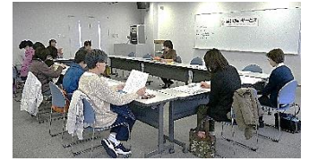
支援に入る前の心構えを勉強中