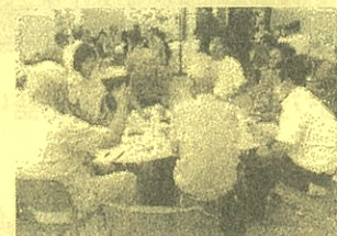
令和7年度SDGs語り合いの様子