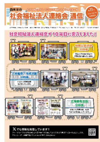
<通信第 11 号>