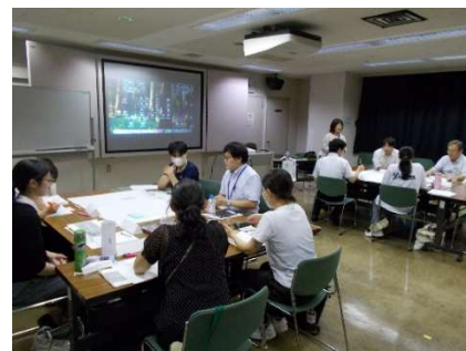
<新任職員向け合同研修>