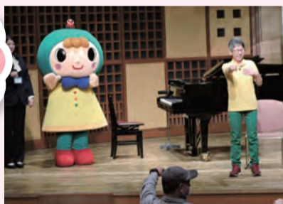
大盛り上がりのじゃんけん大会