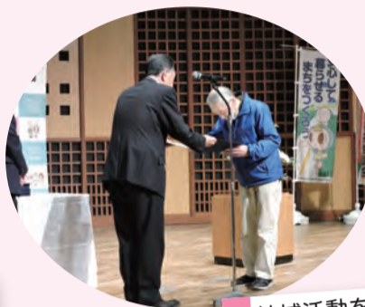
地域活動を継続している方を表彰しました。