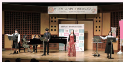
ピアノ演奏、ソプラノとバリトンの二重唄

西東京市の地域福祉活動に長年取り組んでいる方や当会への高額寄附者、協力員等の方々に、感謝の気持ちを込めて表彰を行いました。