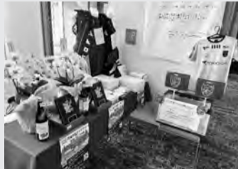
多くのご協賛をいただき、豪華な賞品を用意することができました。