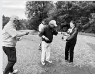
チャリティーホールのご協力ありがとうございました