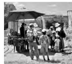
皆さまのあたたかいご支援のおかげで沢山の笑顔が生まれ、育まれています。

問合せ 西東京市社会福祉協議会 福祉活動推進課 地域福祉推進係 〒188-0011 西東京市田無町5-5-12 田無総合福祉センター1階 TEL 042-497-5180 FAX 042-466-3555