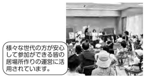
様々な世代の方が安心して参加ができる皆の居場所作りの運営に活用されています。