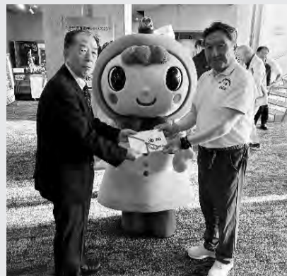
村田大会実行委員長(右)から篠宮会長(左)へ収益金の目録贈呈をしました。